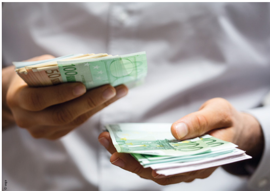
Wer dem Finanzamt Zinsen zahlen muss, wird kräftig zur Kasse gebeten.